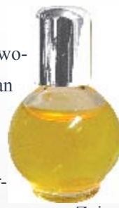
Argentum-Potabile - Flüssiges Silber

Ein behütetes und geheimnisumwobenes Wissen war es, mit dem man Silber in eine flüssige Form zu transformieren und die Silberkraft zu befreien wusste. Die überlieferte Kunst der Adepten vergangener Zeit, Silber zu verflüssigen und es somit dem menschlichen Organismus zu eröffnen, wird nach neuesten Erkenntnissen und überarbeiteten Herstellungsmethoden von uns umgesetzt und findet im „ Argentum-Potabile “ seine glanzvolle Krönung. Nur dieses „ Argentum-Potabile “, das echte „ flüssige Silber “, nicht zu vergleichen mit dem minderen kolloidalen Silber, wird in unsere Silber-Creme eingearbeitet. „ Argentum-Potabile “ ist gewissermaßen die Essenz des Silbers und seiner Kraft.